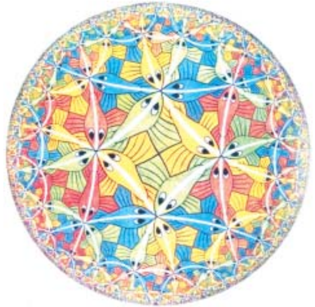
Figure 2 - Le plan hyperbolique vu par M.C. Escher.

Escher a utilisé des pavages de H^2 par exemple, « Limite circulaire III » (figure 2) évoque un pavage par des triangles et quadrilatères réguliers, séparés par des lignes blanches géodésiques.